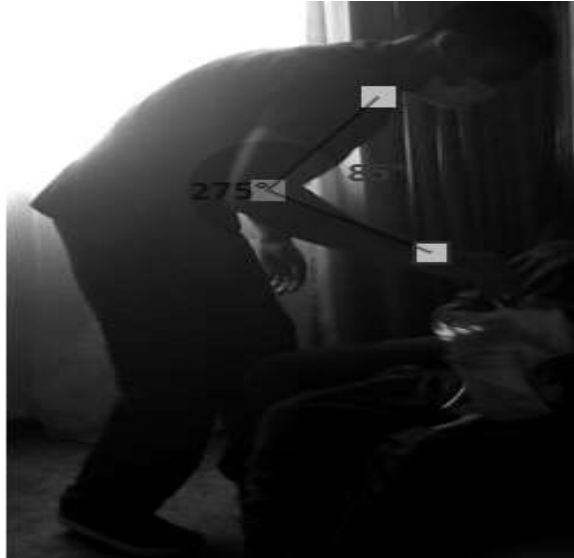
Figura: 5. Flexión de codo: En la figura 5 se muestra la flexión de codo durante la acomodación del equipo de Cistoflo cuyo objetivo es la recolección del orina a través de una sonda vesical. El antebrazo se encuentra entre 60^{\circ} y 100^{\circ} de flexión la puntuación dada es de 2