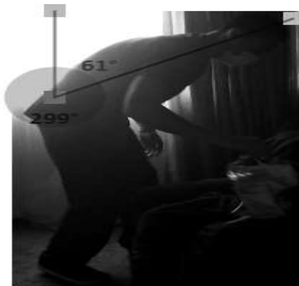
Figura 8: Flexión de tronco

Figura 7: se muestra la realización de Extensión de cuello con 50° durante la manipulación del paciente con una puntuación de 3