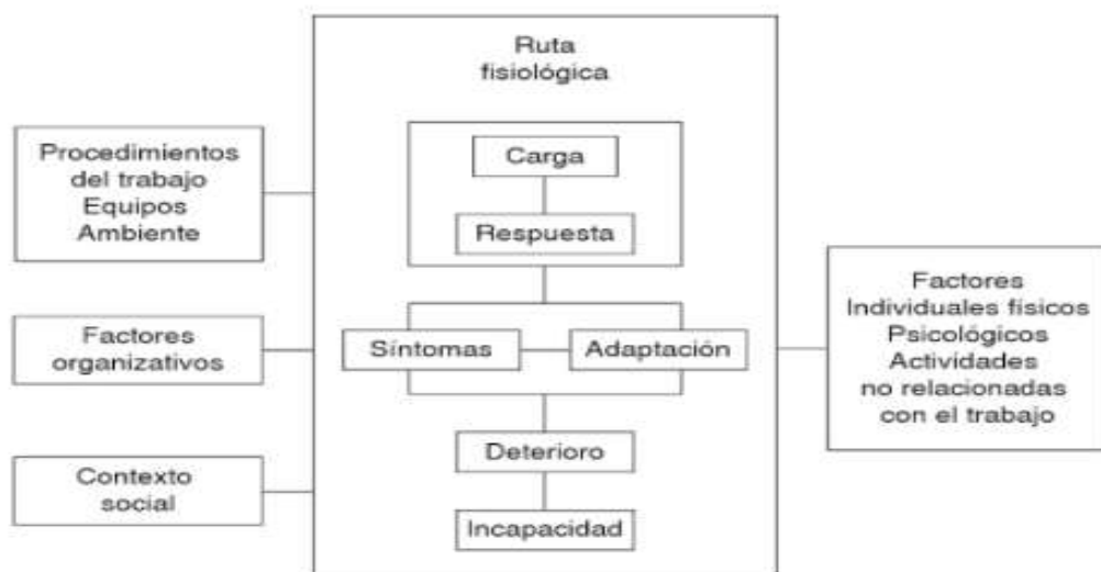
Figura: 1 Mecanismos fisiológicos en desórdenes musculo esqueléticos

La siguiente figura 2 representa los mecanismos fisiológicos que se pueden presentar en los desórdenes musculo esqueléticos