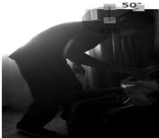
Figura 7: se muestra la realización de Extensión de cuello con 50° durante la manipulación del paciente con una puntuación de 3