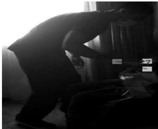
Figura: 6: Extensión de muñeca en durante manipulación de cistoflo.