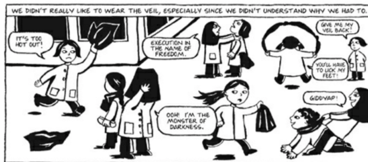
Fig. 1 (Satrapi, 2003, pág 7)

Como se mencionó previamente en el capítulo anterior, la primera categoría que se analiza en este trabajo de investigación, es el de la Vestimenta, vista desde la perspectiva de cómo, en mi papel de lectora, percibí las ideas que a propósito la novela plantea; pues a través de esta es que las autoridades morales y políticas ejercen control y denigran a la figura femenina en el desarrollo de la historia.