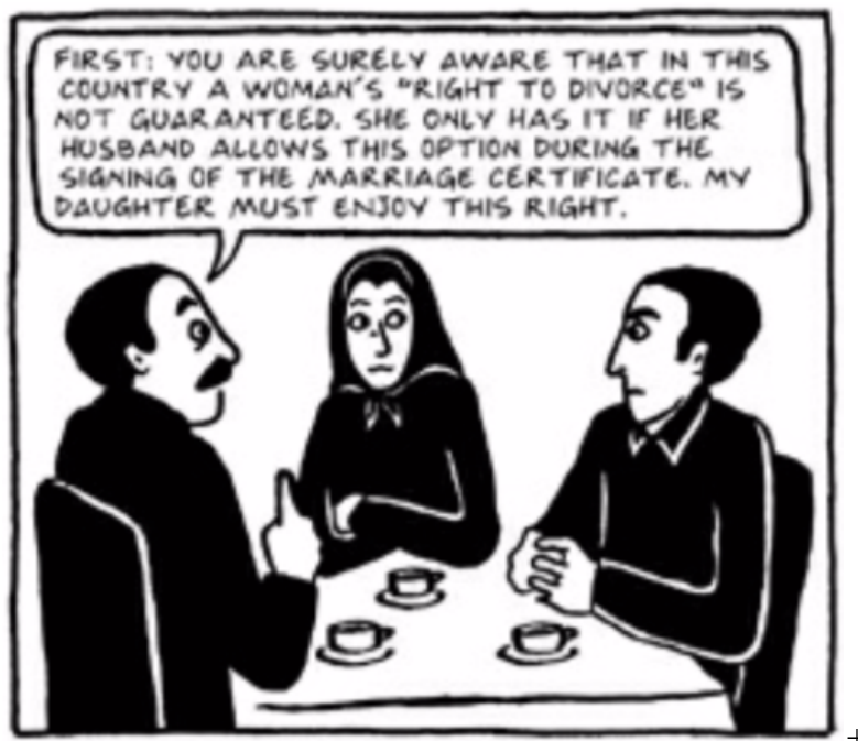
Fig. 14 (Satrapi, 2003, pág 316)

En este fragmento, se evidencia cómo antes de que la protagonista se casara, su padre exigía a su pretendiente que si quería divorciarse debía poder tener el derecho a hacerlo. Esto debido a que en la cultura del islam, si el hombre no aprueba el divorcio la mujer no se puede separar de él. Es por esta razón que es tan peligroso casarse con un hombre que no se conoce del todo, puesto que después las probabilidades de volver a ser libre son pocas. Pero por otra parte, si no se casa también es mal vista por la sociedad, pues no es considerada como una mujer 100% pura o capaz.