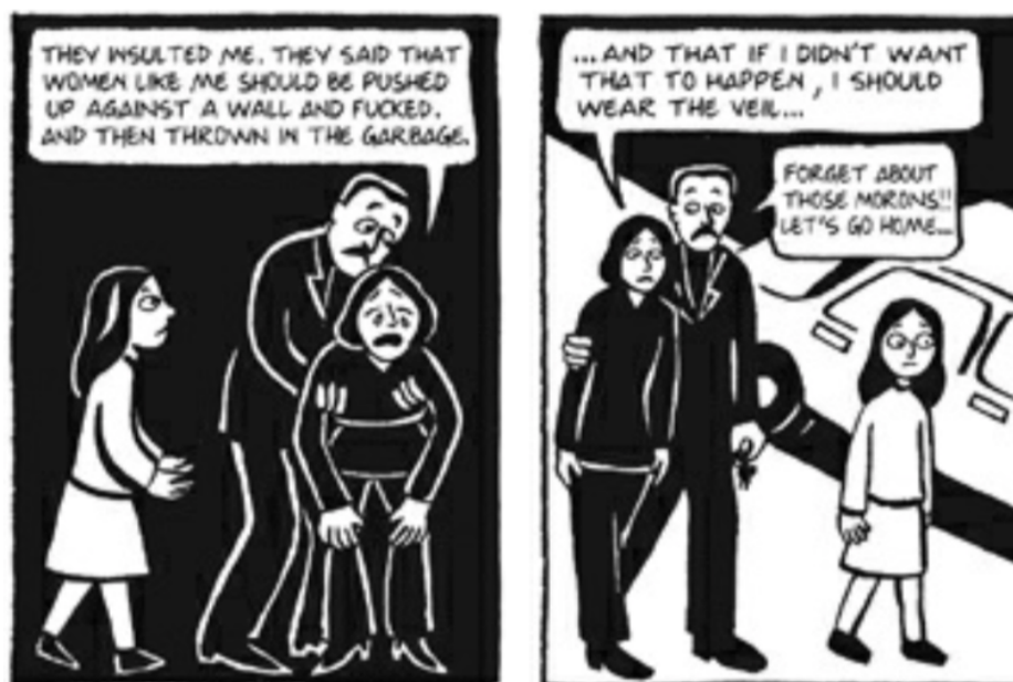
Fig. 2 (Satrapi, 2003, pág 78)

cuerpo porque este está lleno de pecado; y si alguien le hace daño, será porque ella no vestía de la manera correcta, es decir que fue por su culpa. Como lectora, y con base en los planteamientos realizados en el Marco Teórico, la novela, como texto, me hace reflexionar sobre el actuar equivocado que muchas sociedades, como la islámica, han tenido frente al rol de la mujer, minimizándola como ser humano y vulnerándola, desde el momento de su nacimiento.