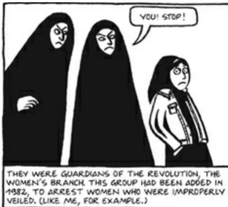
Fig. 3 (Satrapi, 2003, pág 135)

las mujeres pertenecientes a este tipo de ámbitos, llevan una vida cuadrículada, encerradas en un modelo que no pueden escoger si seguir o no.