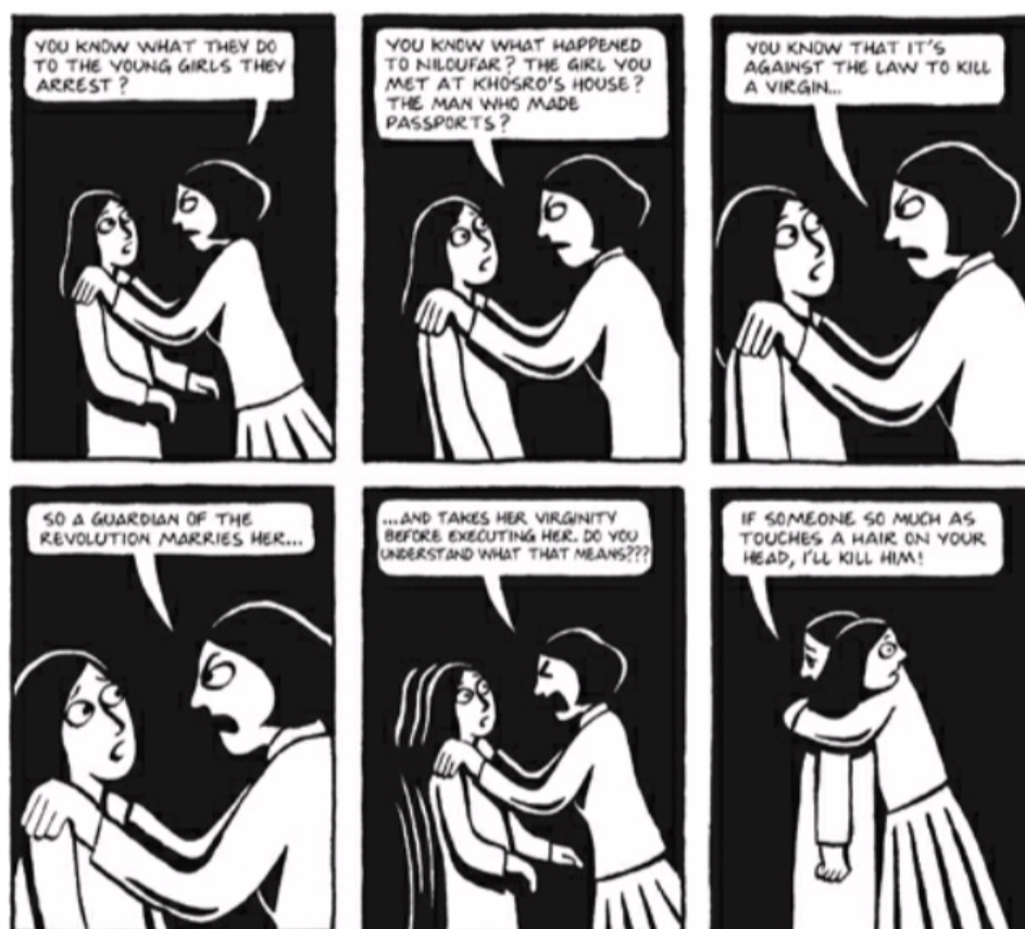
Fig. 5 (Satrapi, 2003, pág 149)

En esta primera figura, se evidencia cómo la madre de la protagonista le explica qué le sucede a una mujer que es arrestada. Una mujer no podía morir siendo virgen, era violada y luego ejecutada. Aquí se refleja el miedo que sentían las mujeres constantemente por cometer un mínimo error, pues el castigo podía ser muy violento y atroz. Es por esta razón que todas debían seguir al pie de la letra todas las normas que se les impusieran, por miedo a ser lastimadas o asesinadas. A pesar de esto, cabe resaltar que en otro contexto, la virginidad en la religión islámica es sumamente importante, pues esta es la mayor virtud que una mujer posee y es también la más codiciada por los hombres. Es por esto que en este fragmento de la novela, la virginidad de Niloufar, la mujer que usa como ejemplo la madre de Marjane, se reduce a algo que no puede quedar inconcluso antes de ser ejecutada, pues no es valiosa ni merece respeto. Es así como se demuestra la importancia de esto que se llama virginidad, que