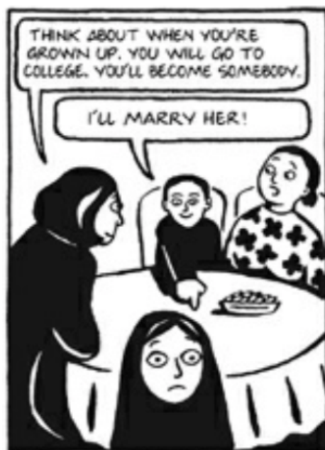
Fig. 12 (Satrapi, 2003, pág 104)

En este fragmento, se evidencia cómo en el contexto de la persecución política y el genocidio colectivo a los opositores del régimen del Sha , una mujer visita en la cárcel a su esposo antes de ser ejecutado. Él le dice que ser madre soltera significaba vergüenza y deshonor y por esta razón es mejor no dejarla embarazada. Lo lamentable en esta escena es que a pesar de que la razón por la cual la mujer va a ser madre soltera es porque su marido fue ejecutado por el gobierno, igualmente será juzgada por la sociedad. Esto quiere decir que sea cual sea el contexto en el que una figura femenina se encuentre vulnerable o en desventaja, siempre será su culpa. Por otra parte, en otro contexto, si el hombre no quiere reconocer al hijo, los familiares de la mujer lo buscan para matarlo, pero la mujer es expulsada de su casa por esta situación, debido a que se presume que esto sucedió porque ella estuvo con alguien que no era su marido. Es decir, se cree ciegamente que la mujer hizo algo mal y es su culpa, por eso debe pagar las consecuencias y vivir con vergüenza y deshonor.