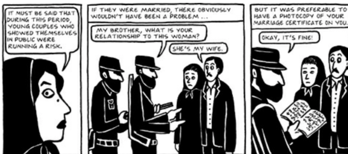
Fig. 13 (Satrapi, 2003, pág 291)

pequeño ya tiene pensamientos de que se casará con la mujer que él quiera cuando crezca. Es contradictorio pensar que a un varón se le podían inculcar este tipo de intenciones y a las mujeres se les reprendía por no cubrirse bien y querer tentar al sexo opuesto. Con esto queda demostrado que las enseñanzas de esta cultura están llenas de incoherencias y buscan siempre ocultar la responsabilidad que posee el hombre en casos como estos. En otras palabras, no es posible justificar que una mujer sea culpable de llamar la atención de un hombre cuando está cubierta de pies a cabeza y se le prohíbe hablar con desconocidos, cuando a las figuras masculinas se les enseña que su único objetivo en la vida debe ser el escoger a las mujeres que desee y que ellas deban ser sumisas, nobles, complacientes y calladas .