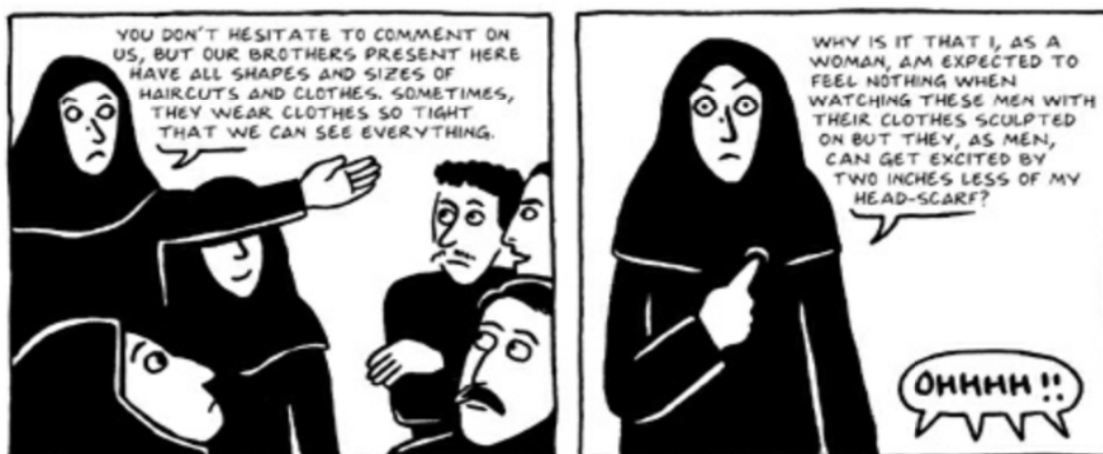
Fig. 4 (Satrapi, 2003, pág 299)

profundamente arraigados y enseñados en esta cultura. No había espacio para considerarla como un ser igual al hombre, ni siquiera como un ser humano. Y puedo afirmar que más allá de seguir tradiciones basadas en la religión, el objetivo de prácticas como estas se fundamentan sólo en el hecho de poner al hombre en un pedestal y a la mujer en el suelo.