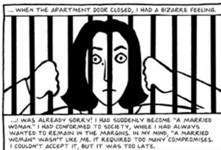
Fig. 15 (Satrapi, 2003, pág 320)

En uno de los últimos fragmentos de la obra, tomados de la página 320, se observa cómo la protagonista se dibuja a sí misma tras unas rejas en la cárcel, pues afirma que así se sintió después de haberse casado. Esta era la única forma de saber si el hombre con el que estaba saliendo era el correcto para su vida. Dicha situación indiscutiblemente hace reflexionar y pensar en que de una forma u otra las mujeres en esta cultura deben aceptar lo que pase con sus vidas y actuar con sumisión ante cualquier suceso. No tienen derecho a decir que algo no les gusta o estar en desacuerdo con algo porque simplemente es algo que una mujer no puede hacer.