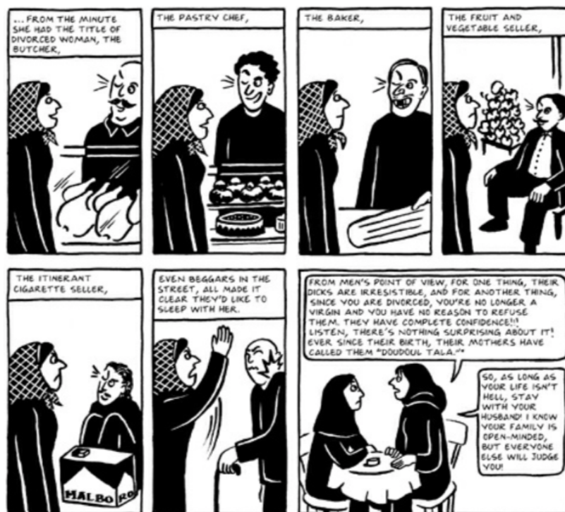
Fig. 10 (Satrapi, 2003, pág 335)

nada nuevo que aportar a los estudiantes en términos de educación sexual. Los contenidos impartidos eran los mismos de hace siglos, lo cual evitaba progreso en la mentalidad de las personas. Ahora bien, cabe mencionar que el objetivo principal del matrimonio en el islám es procrear, por eso el hecho de que una mujer decida no tener hijos va en contra de todos los valores de la religión. O por otra parte, una hipótesis que confirma el anterior enunciado podría ser que la sociedad iraní cree que una mujer planifica porque tiene una vida sexual demasiado activa y si solo tiene una pareja, no hay razón para cuidarse. De hecho, es sorprendente que la libre circulación de este tipo de medicamentos fuera asequible para aquellas mujeres quienes no querían ser madres.