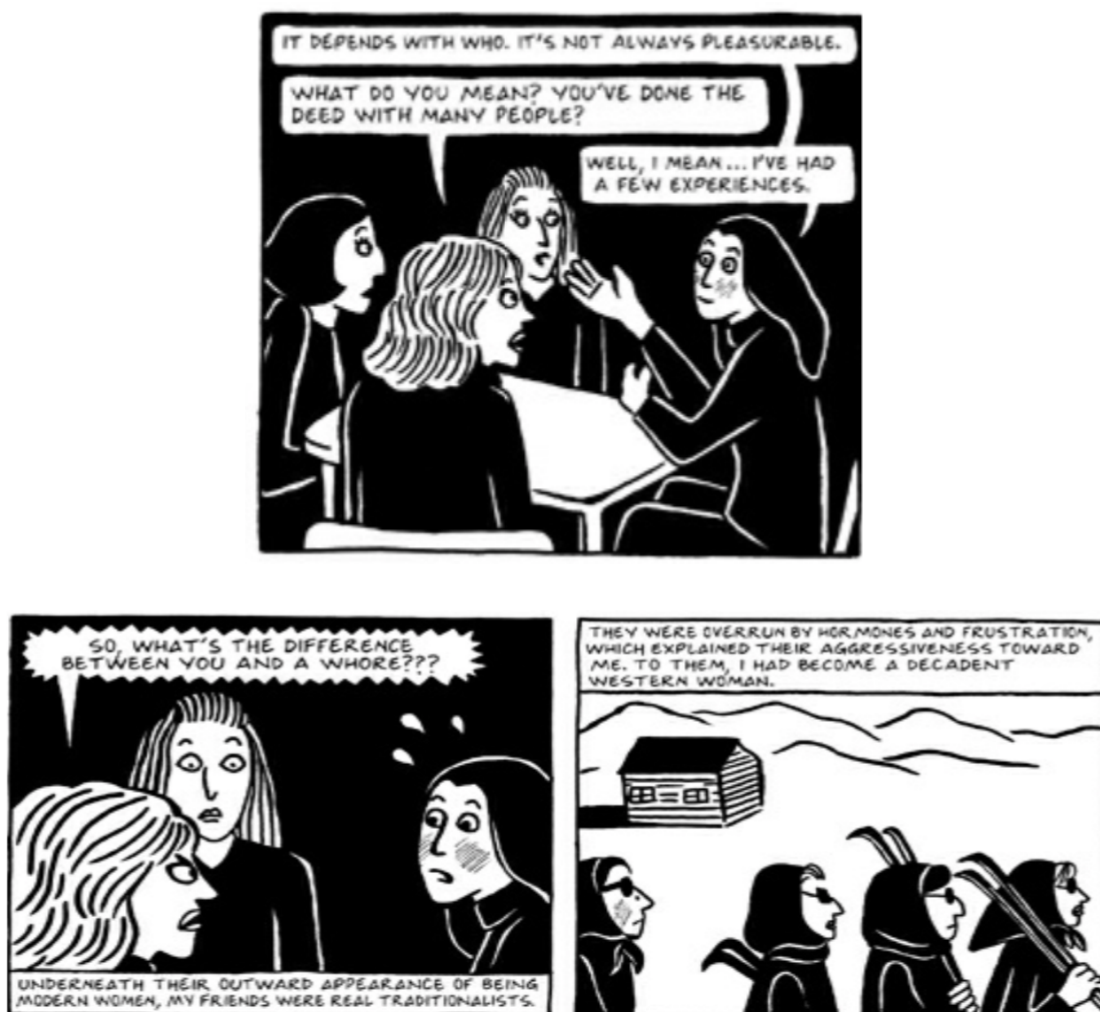
Fig. 8 (Satrapi, 2003, pág 273)

Después de caer en una profunda depresión y estar al borde de la muerte por diversas razones, Marjane llama a sus padres y les confiesa que ya no quiere vivir más en Viena, que desea volver a Teherán con ellos. Cuando Marjane vuelve de Europa, se da cuenta de que su pensamiento es diferente al de sus amigas que se quedaron en Irán. Esto debido a que en una salida programada para que ella les contara sobre su experiencia en Austria, ella confiesa que a parte de que ya no es virgen, ha tenido más de una experiencia sexual. Sus “amigas” la juzgan y comparan con una prostituta por esta confesión. Es así como, una vez más en el desarrollo de la novela, el rechazo y violencia ejercida hacia la mujer, procede también de una mujer. Y este odio interiorizado proviene de las prácticas culturales enseñadas desde la