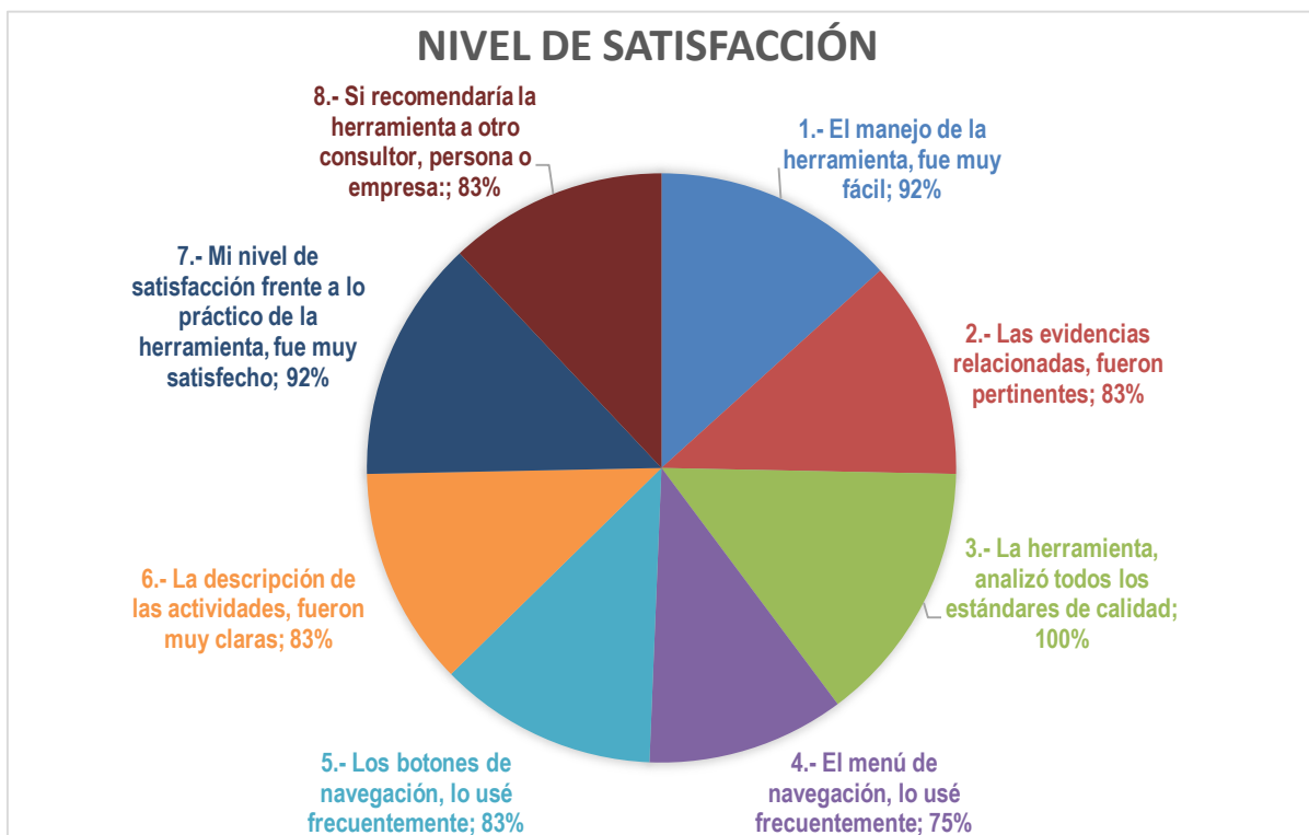
Figura 1. Nivel de satisfacción