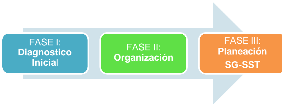
Figura 1 Fases metodológicas

Para el desarrollo de este proyecto se ejecutará por etapas de acuerdo con cada objetivo específico y las actividades corresponderán a la necesidad de alcance para el plan metodológico con un proceso sistemático, organizado y crítico, con las cuales se busca dar cumplimiento al objetivo general de la investigación.