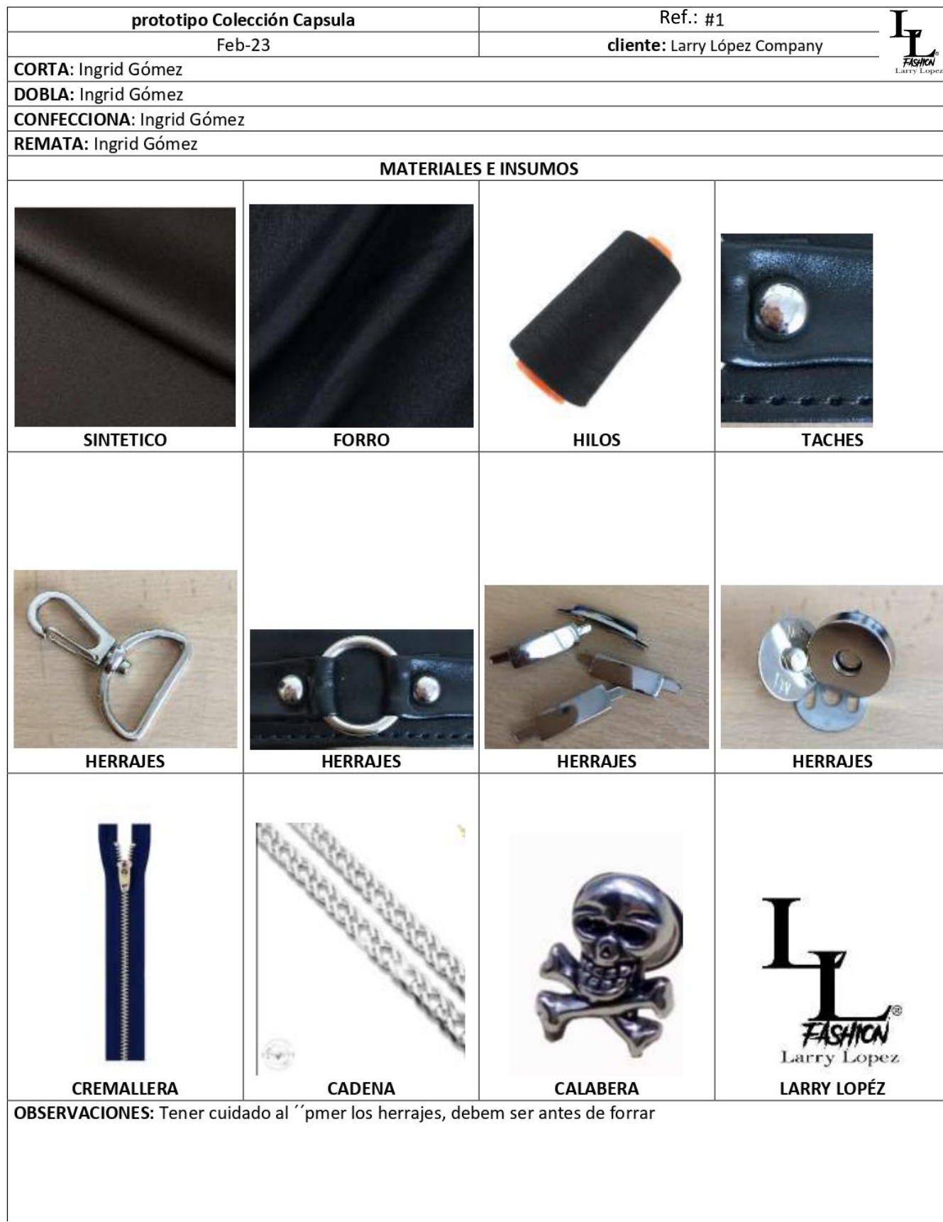
Tabla 5 fuente Larry López