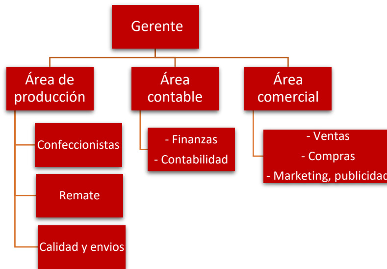
Gráfico 1