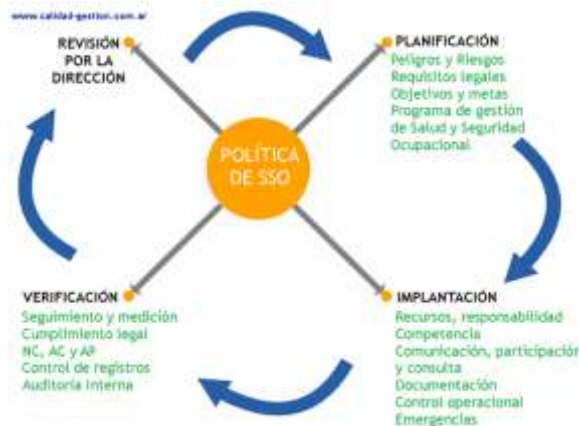
Ilustración 2. Ciclo Deming

Un Sistema de Gestión SSO (SGSSO) es una herramienta, a disposición de una organización, para ayudarla a alcanzar sus objetivos de salud y seguridad ocupacional, incluyendo la estructura organizativa, la planificación de las actividades, las responsabilidades, los procedimientos y los recursos necesarios para desarrollar, implantar, revisar y mantener al día su Política de Salud y Seguridad Ocupacional. . (Gonzalez, 10 de Junio de 2014)