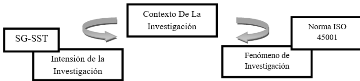
Ilustración 1. Focos de interés para la investigación y la manera en que estos se conectan entre sí

De acuerdo con el tema de este estudio, el estado de arte se enfocó en la búsqueda investigaciones y artículos provenientes de bases de datos especializadas, con el fin de evidenciar aportes en torno al sistema de gestión de seguridad y salud en el trabajo y bajo la norma ISO 45001 que puedan guiar las actividades de implementación, mantenimiento y mejora continua.