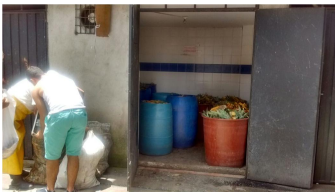
Ilustración 9 Fuente. Plaza de Mercado