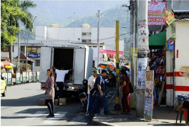
Ilustración 6