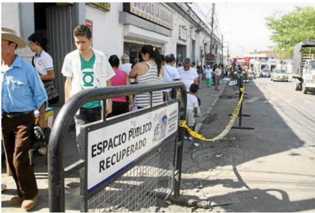
Ilustración 7