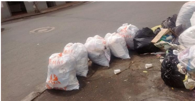
Ilustración 5 Fuente. Plaza de mercado