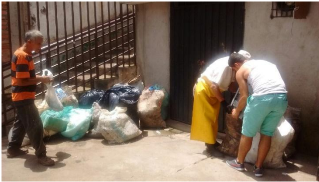
Ilustración 10 Fuente. Plaza de Mercado