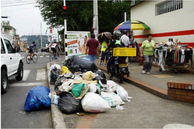
Ilustración 3 Fuente. Plaza de mercado.