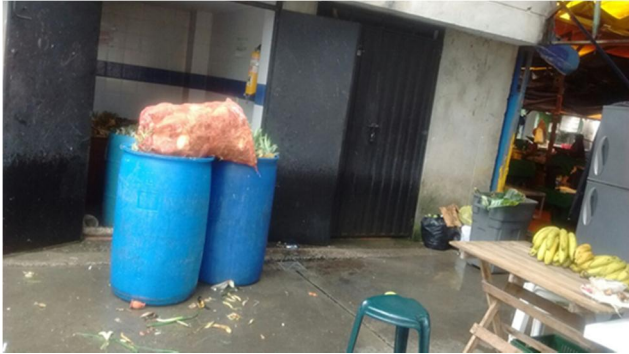
Ilustración 8 Plaza de Mercado

La falta del cuarto que está pidiendo la plaza impide darle la continuidad a la aplicación del PGIRS.