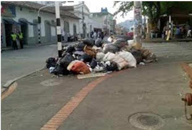
Ilustración 4 Fuente Vanguardia Liberal.