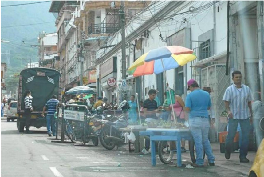
Ilustración 11

En los alrededores de la plaza de mercado ya mencionada se hallan completamente invadidas de vendedores que comercializan sus productos; se puede observar que estos vendedores han establecido casi que otra plaza externa. Como se puede apreciar el espacio destinado a la libre circulación de peatones y vehículos están desapareciendo.