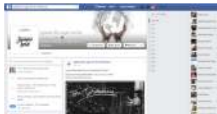
Imagen 4: Facebook