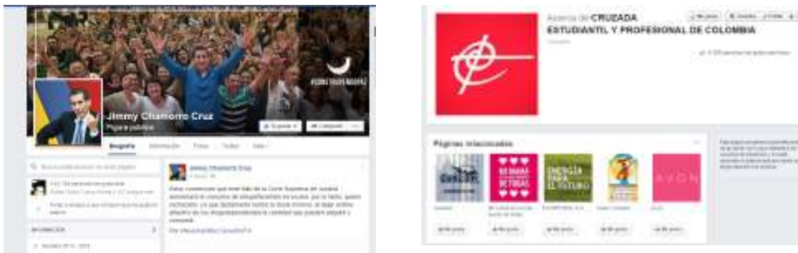
Imagen 11: Facebook del Señor Jimmy Chamorro y la Iglesia Cruzada Estudiantil y Profesional de Colombia