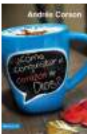
Imagen 2: Libro de Andrés Corson