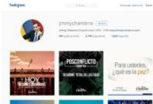
Imagen 12: Instagram Jimmy Chamorro Fuente: https://www.instagram.com/jimmychamorro/ Fecha: 28/02/2016