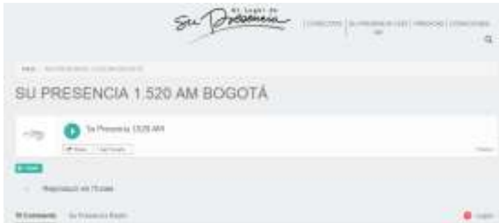
Imagen 7: Radio

Cuentan con su propia emisora virtual y en frecuencia AM