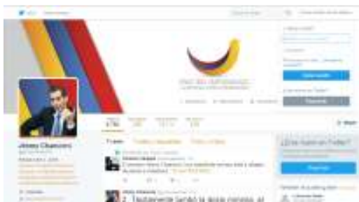
Imagen 13: Twitter Jimmy Chamorro Fecha: 28/02/2016