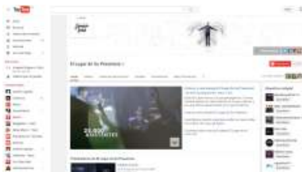
Imagen 8: Youtube