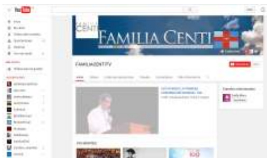
Imagen 14: Canal Youtube de la Iglesia Cruzada Estudiantil y Profesional de Colombia Fecha: 28/02/2016