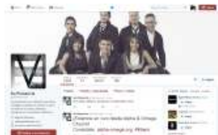
Imagen 6: Twitter