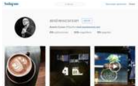
Imagen 5: Instagram