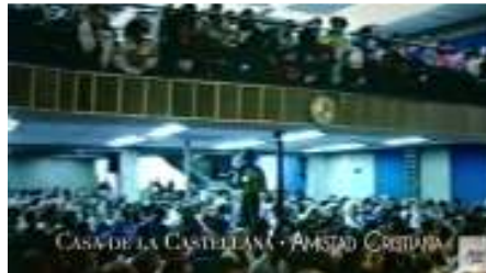
Imagen 3: Inicios de la Iglesia El Lugar de Su Presencia