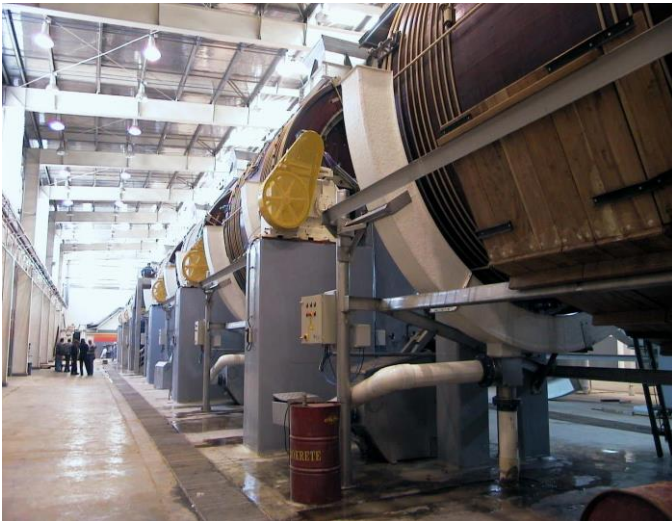
Ilustración 3 Con tecnología