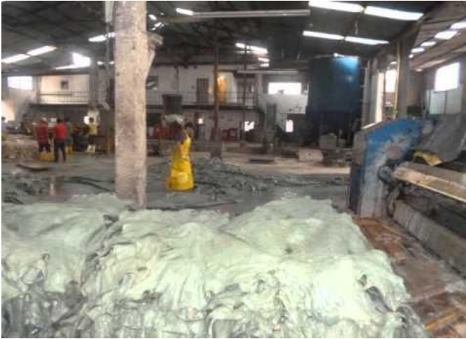
Ilustración 2 Sin tecnología