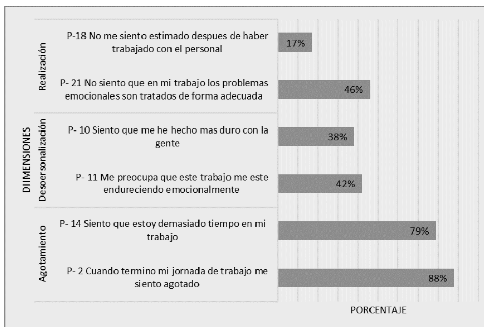
Gráfica 1 Preguntas de mayores puntuaciones en cada una de las dimensiones.