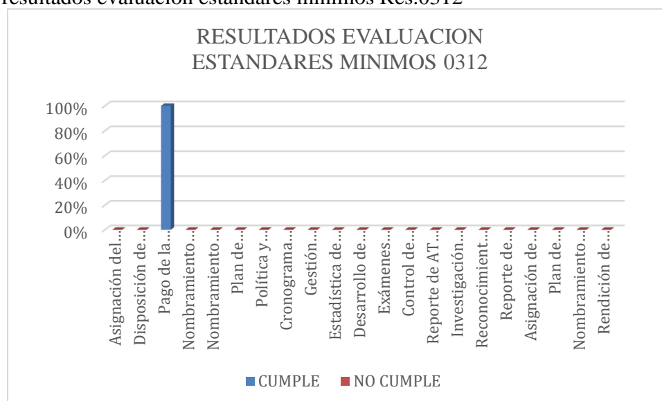
Grafica 1. resultados evaluación estándares mínimos Res.0312