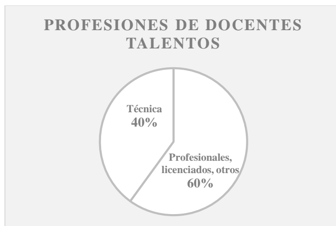
Ilustración 5. Nivel educativo docentes TALENTOS