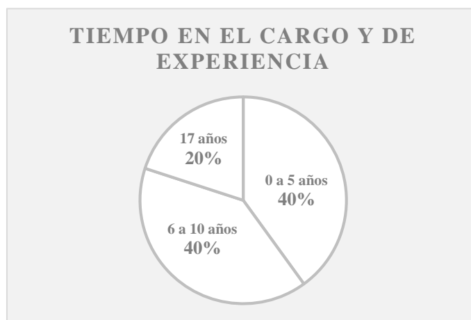
Ilustración 6. Experiencia docente TALENTOS

La población docente de TALENTOS prevalece el género femenino con un 86%, la edad promedio es de 32 años de los participantes de la investigación, los estados civiles de las colaboradoras son soltera, casadas y en unión libre. Cuentan con estudios técnicos, profesionales y otros los cuales les han permitido crecer dentro de la institución, por eso el tiempo de experiencia en la profesión es similar a la del cargo, la cual se encuentra a partir de los 2 hasta los 17 años.