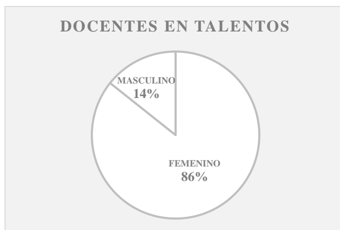
Ilustración 2. Género docentes TALENTOS

Del 100% de los docentes (n=7) de TALENTOS, solo el 71,4% (n=5) autoriza y participa en la presente investigación. Un 14,3% (n=1) masculino y un 14,3% (n=1) femenino del 86% de la población de género femenino no participan.