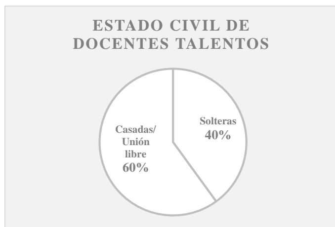
Ilustración 4. Estado civil docentes TALENTOS

Las profesiones de bases de las docentes de TALENTOS que participaron en la investigación se puede decir: El 60% (n=3) cuentan con título profesional, licenciatura y otros, el 40% (n=2) cuentan con técnicas. El tiempo de antigüedad en el cargo es igual al de experiencia, entre 0 a 5 años (n=2) el 40%, entre la edad de 6 a 10 años (n=2) el 40% y el 20% (n=1) cuenta con 17 años de experiencia en la institución y en el cargo.